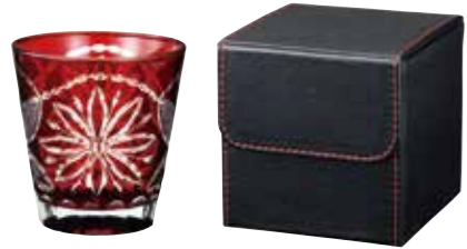
No.1456 グレース オールドグラス (RD) 3,000yen(税抜) □セット内容・材質 / グラス(Φ85×90mm、260ml、ソーダガラス、1個) ケース(100×100×100mm、ポリウレタン、1個) □箱サイズ / 105×105×105mm □総重量 / 360g(中国製)

赤のステッチが効いたレザー調のお洒落なケースと切子グラスのコンビネーションギフト。ケースは、時計や鍵などの小物入れにも最適。