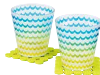
No.2332 ブランシュ オフタイム