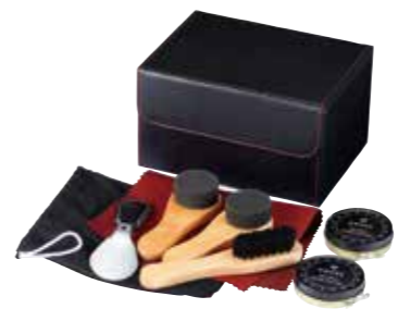
No.3707 Modello シューシャインセット 3,000yen(税抜)

□セット内容・材質 / ケース(160×120×95mm、ポリウレタン、1個)靴クリーム(Φ65×15mm、17.5ml、黒・無色、各1個)ブラシ(133×25×2.5mm、木、ポリプロピレン、1個)スポンジ(106×40×28mm、木、ウレタン、2個)布(240×150mm、ポリエステル、1枚)袋(145×150mm、不織布、1枚)靴べら(120×40×10mm、スチールクロムメッキ、合皮、1個) □箱サイズ / 165×125×100mm □総重量 / 400g(中国製) スポンジブラシは、黒、無色クリーム2色に合わせて2本ご用意いたしました。不織布の袋に入れて手軽に持ち運びできます。