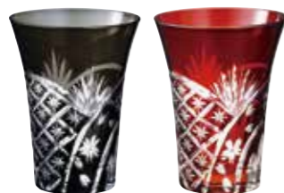
No.1915 ジパング タンブラー(ペア)

熟練の職人が色ガラスの内側に透明ガラスを吹き込むことで二重になった色被ガラスに、カッティングを施したハンドメイドの逸品です。