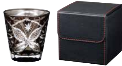
No.1455 グレース オールドグラス (BK) 3,000yen(税抜) □セット内容・材質 / グラス(Φ85×90mm、260ml、ソーダガラス、1個) ケース(100×100×100mm、ポリウレタン、1個) □箱サイズ / 105×105×105mm □総重量 / 360g(中国製)

赤のステッチが効いたレザー調のお洒落なケースと切子グラスのコンビネーションギフト。ケースは、時計や鍵などの小物入れにも最適。