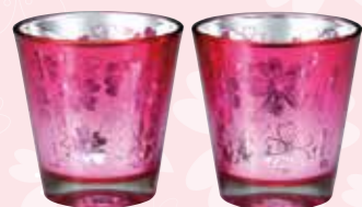
No.1423 Sakura グラス (ペア)

3,000yen (税抜) □セット内容・材質 / グラス (Φ85×90mm、 260ml、ソーダガラス、2個) □箱サイズ / 180×92×97mm □総重量 / 580g (中国製)