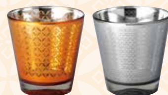
No.1425 エンペラーグラス (ペア)

3,000yen (税抜) □セット内容・材質 / グラス(φ85×90mm、260ml、 ソーダグラス、2個) □箱サイズ / 180×92×97mm □総重量 / 580g (中国製)