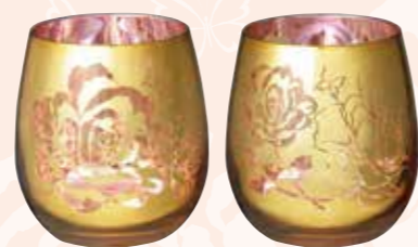
No.1428 Roseグラス (ペア)

5,000yen (税抜) □セット内容・材質 / グラス(φ75×90mm、400ml、ソーダグラス、2個) □箱サイズ / 180×92×97mm □総重量 / 500g (中国製)