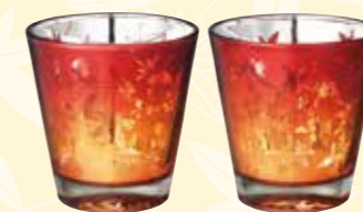
No.1426 Momiji グラス (ペア)

3,000yen (税抜) □セット内容・材質 / グラス (Φ85×90mm、 260ml、ソーダガラス、2個) □箱サイズ / 180×92×97mm □総重量 / 580g (中国製)