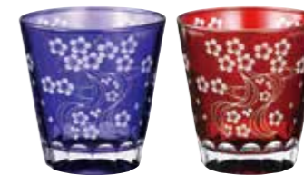
No.1451 Yozakura グラス(ペア)

日本人のルーツともいえる幻想的な夜桜のモチーフをサンドブラスト加工により、美しく繊細なデザインとして浮かび上がらせました。