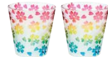
No.1424 舞桜 グラス(ペア)

幸運を象徴するレインボーカラーの グラスは、日本人になじみ深い桜の モチーフをサンドブラスト加工に より浮かび上がらせたものです。