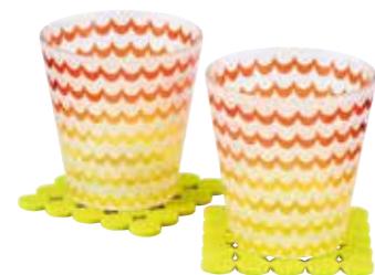
No.2331 ブランシュ オンタイム