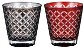
No.1452 チェス グラス(ペア)

懐かしいのに新しい。和っぽいのに洋の香り…。そんな幾何学模様は、人気の図柄で、シーンを選びません。