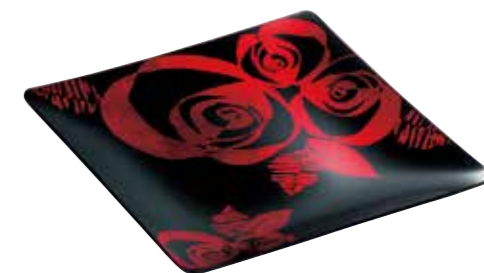
No.1611 Viva rosa ローズプレート 3,500yen(税抜) □セット内容・材質 / プレート(265×265×25mm、 ソーダガラス、1枚) □箱サイズ / 287×287×38mm □総重量 / 820g(中国製)